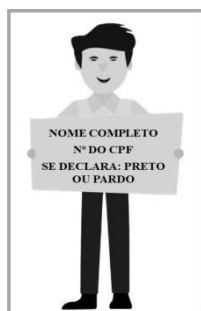
Figura 3. Modelo de Autodeclaração para o vídeo.