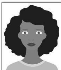
Figura 1. Modelo de Foto Frontal